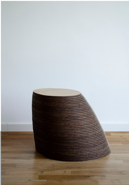
1 STONE, 2020 Bambù 60 x 55 x 44cm