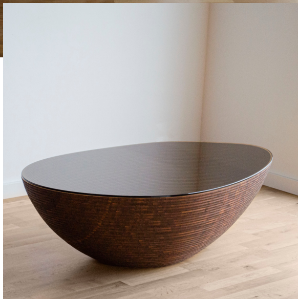
3 Coll. STRATUM SAXUM, 2020 Tavolino da caffè Bambù, vetro 120 x 70 x 35cm