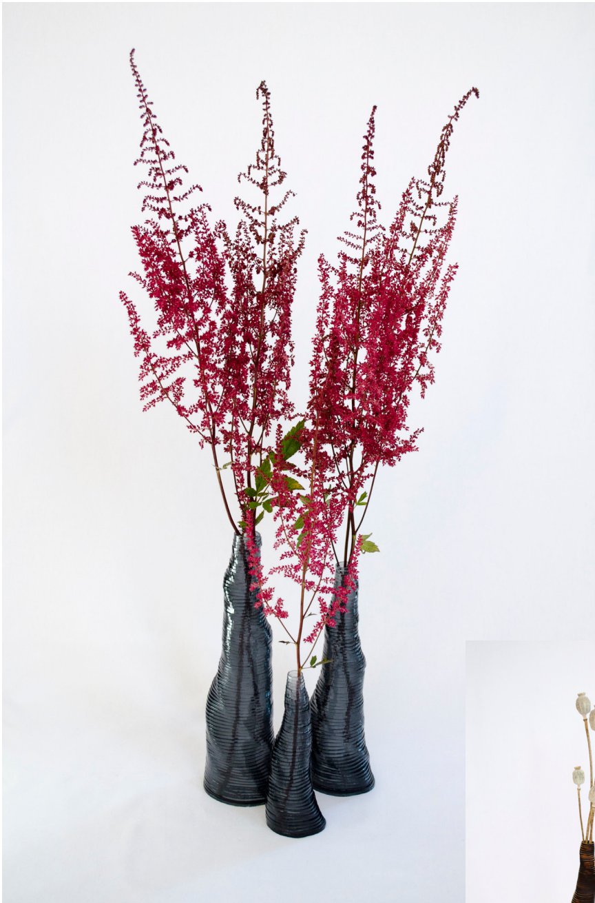
4 STRATUM TEMPUS, 2019 Collezione di vasi Bambù, acrilico Dimensioni variabili

La collezione Stratum si basa su un uso consapevole dei materiali che permette la creazione d'oggetti con la minor quantità possibile di materiali e di scarti. Tagliando fogli in strati concentrici e assemblandoli a mano, il designer ottiene oggetti cavi, conici e di forma organica che sono fatti a mano nel suo studio. Sono prodotti su piccola scala e principalmente su richiesta. In modo da evitare la sovrapproduzione.