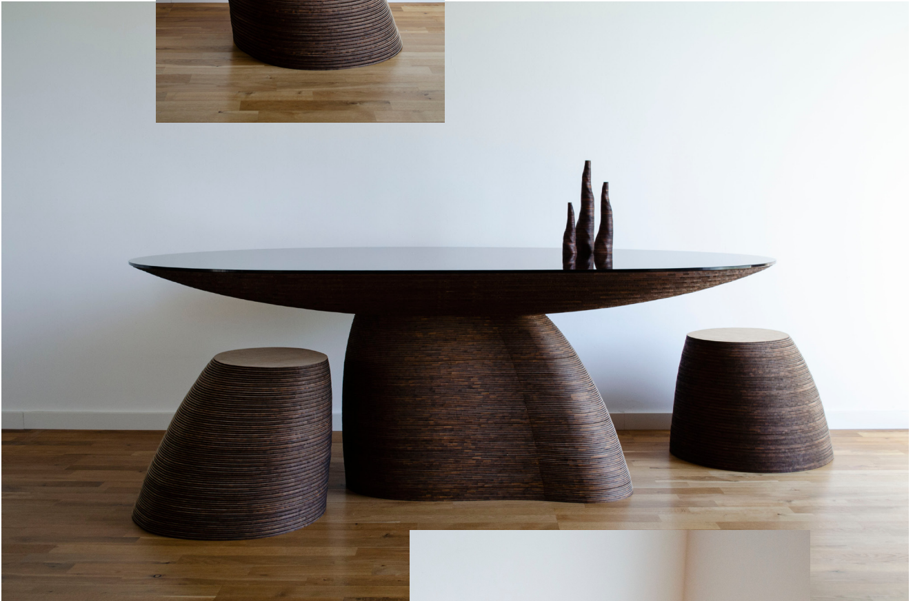
2 Coll. STRATUM SAXUM, 2020 Tavolo da pranzo Bambù, vetro 200 x 110 x 74cm